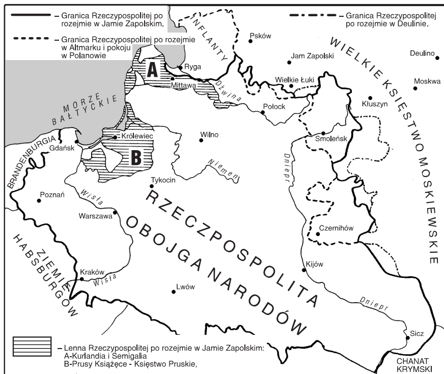
Rzeczpospolita w latach 1569–1648

W czerwcu 1626 r. wojska szwedzkie podjęły ponownie walki w Prusach Królewskich. Wybuchła wojna o ujście Wisły 1626–1629 . Rzeczpospolita do wojny nie była przygotowana. Szwedzi wkroczyli na Pomorze Gdańskie. Zajęli Piławę, zmuszając lennika polskiego księcia pruskiego do zachowania neutralności. Prawie wszystkie miasta pruskie znalazły się w rękach szwedzkich. Rozpoczęła się blokada morska Gdańska. Nieliczne i słabo uzbrojone wojska polskie poniosły porażkę pod Gniewem.